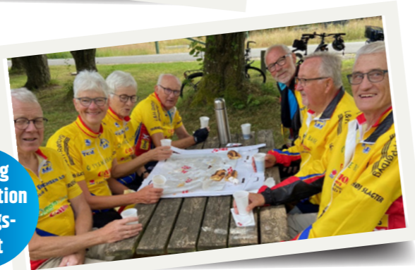
Tjerring Cykel Motion Torsdags- holdet